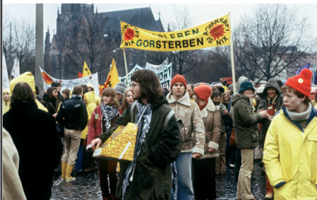
Demonstration gegen die atomare Aufbereitungsanlage in Gorleben.

Unter starkem politischen Druck verlangte die Bundesregierung – gegen die Meinung der Niedersächsischen Landesregierung – das Kraftwerk Buschhaus erst zwei Jahre später, dann mit einer funktionierenden Rauchgasentschwefelungsanlage, in Betrieb zu nehmen. Die SPD beantragte im Juli 1984 eine Sondersitzung des Deutschen Bundestages, zu der viele Abgeordnete aus dem Urlaub gerufen werden mussten. Nach einem Kompromiss sollte das Kraftwerk Buschhaus ohne Raugasentschwefelungsanlage, aber auch ohne schwefelhaltige Salzkohle, dafür mit „normaler“ Braunkohle, ans Netz gehen. Das geschah im März 1985. Eine neue Rauchgasentschwefelungsanlage wurde nach modernster Technik auf Regenerationsbasis entwickelt und die BKB dafür 1987 mit dem deutschen Recyclingpreis ausgezeichnet. Dennoch war es für das Niedersächsische Umweltministerium nicht leicht, wieder aus den negativen Schlagzeilen herauszukommen.