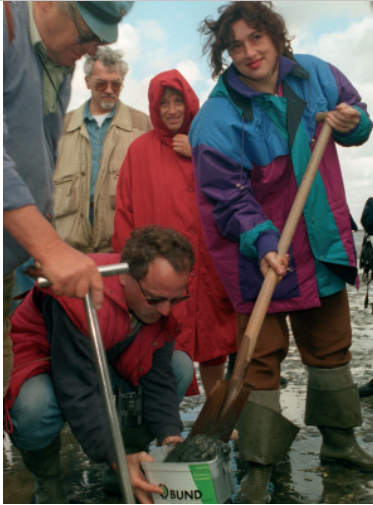
Griefahn besichtigt 1996 „schwarze Flecken“ im Watt.

aber parallel per Dienstwagen an den weit entfernten Zielort bringen. Den damaligen Vorsitzenden der CDU-Landtagsfraktion, Jürgen Gansäuer, brachte das „unkonventionelle“ Agieren von Griefahn & Co. schon 1991 derart in Wallung, dass er in einer Sitzung des Landtages wetterte: „Die Spitze des Umweltministeriums gleicht eher einer konspirativen Untergrundorganisation als einer ordnungsgemäßen Landesverwaltung.“