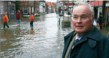
Hochwasser in Niedersachsen - Umweltminister Sander 2006 in der Altstadt von Hitzacker.

Mit großem persönlichem Einsatz kämpfte Sander auch dafür, vom Hochwasser geplagten Elbanrainern zu helfen. So drückte er durch, dass in Hitzacker mit Millionenaufwand eine Schutzmauer um die malerische Altstadt gezogen wurde, und im kleinen Alt-Garge brachte er zur Freude der Bewohner im Alleingang ein Deichbauprojekt auf den Weg. „Da ist Herzblut drin“ bekennt Sander, der sich ausgerechnet nach erfolgreicher Bekämpfung der letzten großen Flut mit einem Vorstoß der SPD für einen Untersuchungsausschuss konfrontiert sah. Doch die Sozialdemokraten machten flugs einen Rückzieher, zumal die Jungen Liberalen feixten, dass ausgerechnet Oppositionsführer Jüttner während des Großeinsatzes an der Elbe schnorchelnd in der Karibik abgetaucht war.