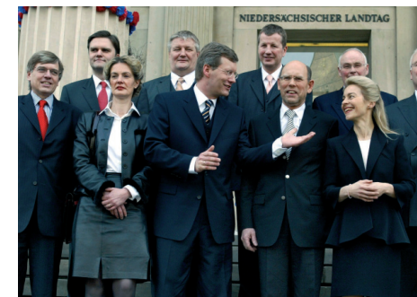
Der damalige Ministerpräsident Wulff stellt 2003 sein Kabinett vor.