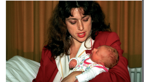
Monika Griefahn mit ihrer Tochter.

Für Furor sorgte die Ausweisung zweier großer Nationalparks in der Amtszeit von Monika Griefahn. Zum Schutzgebiet Wattenmeer gesellten sich der Nationalpark Harz und die Elbtalaua, die heute zwar als Biosphärenreservat firmiert, inhaltlich aber einem Nationalpark gleichkommt. „Das waren für mich die schönsten Erfolge“, sagt die Politikerin im Rückblick. In beiden Fällen mussten erhebliche Vorbehalte in der Bevölkerung ausgeräumt werden. Vor allem im Grenzraum zur früheren DDR bestand die Befürchtung, erneut über Gebühr eingezogen zu werden in der Nutzung