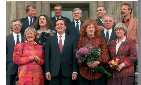
Das Landeskabinett 1990.