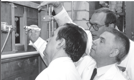
Tschernobyl-Folgen – die damaligen Umweltminister Töpfer und Remmers im ehemaligen Kernkraftwerk Lingen.

Die Schwierigkeiten, mit denen der neue Umweltminister Remmers zu kämpfen hatte, waren zum großen Teil Altlasten, die die Vorgängerregierungen hinterlassen hatten. So war das neue Ressort durchweg defensiv ausgerichtet. Ministerpräsident Albrecht wollte aber gerade mit dem Umweltministerium positive Akzente setzen. Es sollte mehr agiert und weniger reagiert werden. Doch Remmers blieb kaum etwas anderes übrig, als zu reagieren. Er tat es bei neuen Herausforderungen meistens sehr sensibel. Dabei wusste er, dass er ein Ministerium übernommen hatte, in dem man eigentlich nur verlieren konnte. „Es gibt Jobs, mit denen man nur scheitern kann“, sagte er einmal in vertrauter Runde, als wieder etwas schief gelaufen war. Er musste auch oft erkennen, dass die Gesellschaft auf einen präventiven Umweltschutz einfach noch nicht vorbereitet war. Das zeigte sich deutlich, als er zum ersten Mal überhaupt einen Umweltbericht erstellte. Es war schon das richtige Signal zur richtigen Zeit, aber die Gesellschaft war offensichtlich noch nicht bereit, ihm zu folgen.