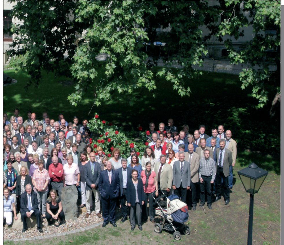
of des Umweltministeriums.