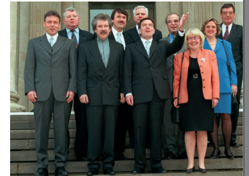
Das Landeskabinett 1998.

Auch inhaltlich ließ es Jüttner moderat angehen. Er verstand sich als „pragmatischer Linker“, dem es erfolgversprechender erschien, Umwelt- und Naturschutz auf kooperative statt auf konfrontative Art voranzubringen. Das schloss gelegentliche Härte in strittigen Punkten nicht aus. So setzte Jüttner verstärkt auf Modelle, die – angefangen mit dem noch unter Griefahn entwickelten Mediationsverfahren zu München – auf eine möglichst einvernehmliche Lösung konfliktträchtiger Probleme im Umweltbereich