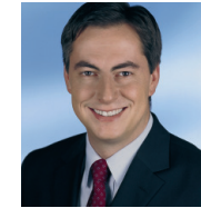
Hans-Heinrich Sander Niedersächsischer Minister für Umwelt und Klimaschutz

Lieber Hans-Heinrich Sander, liebe Mitarbeiterinnen und Mitarbeiter im Niedersächsischen Ministerium für Umwelt und Klimaschutz,