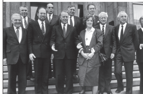
Das neue Kabinett von Niedersachsen im Jahre 1986.